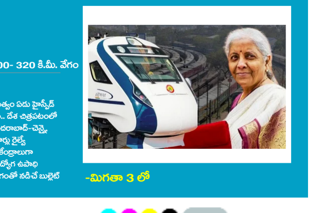
-మిగతా 3 లో

రాష్ట్రానికి 33 బారికల వశ్యులు పన్నులు, సుంకాల్లో 0.72 మేర పెరిగిన వాటా వాటివ్వారా రాష్ట్రానికి రూ.33,180.78 కోట్ల ఆదాయం సమీకండ్లలో మిగిలినా, మెడికల్ టూరిజం హాల్ ఊసు లేదు రాష్ట్రం విజ్ఞప్తులను పట్టించుకోకపోవడంపై విమర్శలు హైదరాబాద్ నుంచి చెన్నై, బెంగళూరు, పుణెలకు హైస్పీడ్ రైళ్లు.. 300- 320 కి.మీ. వేగం