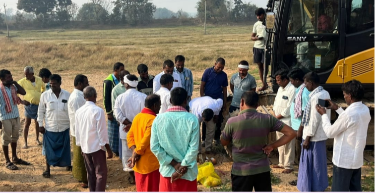
దుబ్బాక - ఫిబ్రవరి 16 (మహాప్రభ)

రైతుల కష్టాలను దృష్టిలో ఉంచుకొని పంటలు ఎండిపోకుండా ప్రత్యేక శ్రద్ధ వహించి పోతారం, అచ్చుమాయిపల్లి, గ్రామాల సర్పంచుల పర్చ దేవరాజు, స్వల్పం మల్లేశం గార్ల సొంత డబ్బులతో ఇద్దరి సమన్వయంతో కాలువ నిర్మాణం కోసం అవసరమైన సిమెంట్ పైపులను కొనుగోలు చేసి తెప్పించారు, హిటాచి తెప్పించి కాలువ గండ్లు పడిన చోట పుడుస్తున్నారూ మల్లన్న సాగర్ 4ూణ కాలువ పనులు ఈరోజు పనులు జరుగుతున్నాయి, ఫోటోలకు ఫోజులిచ్చి రైతులను తప్పదోప పట్టించే కొంతమంది స్వార్థ రాజకీయ నాయకుల మాటలు నమ్మకుండా, కాల్వ పనులు అటంకం కలగకుండా ముందుకు తీసుకుపోయేందుకు రైతులందరూ సహకరించాలని అన్ని గ్రామాల ప్రజలను కోరారు, ఈ కార్యక్రమంలో చుట్టు ప్రక్కల గ్రామాల రైతులు పాల్గొన్నారు, ముందుకు వచ్చి రైతుల కష్టాన్ని అర్థం చేసుకొని కాల్వ పనులు ప్రారంభించినందుకు రెండు గ్రామాల సర్పంచులకు ధన్యవాదాలు తెలియజేశారు.