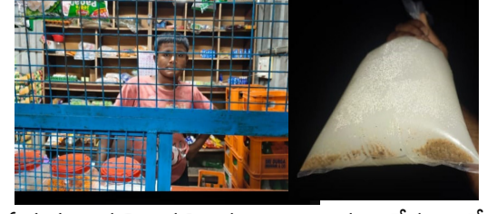
ఏమవుతాయని ప్రశ్నించగా నా ఇష్టం నేను ఇదే విధంగా కళ్ళు విక్రయిస్తాను నీకు ఇష్టం ఉంటే తీసుకో