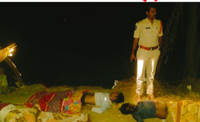
స్థానికులు వెంటనే 108 సిబ్బందితో పాటు పోలీసులకు సమాచారం అందించగా.. క్షతగాత్రులను పరిశీలించిన వైద్య సిబ్బంది.. ప్రాణాలు

కామారెడ్డి జిల్లా గాంధారి మండలం ఎన్ బి అంజనేయులు, తెలిపిన వివరాల ప్రకారం రాంపూర్ గడ్డ సమీపంలో శనివారం రాత్రి సమయంలో ద్విచక్రవాహనం అదుపుతప్పి పట్టి కొట్టడంతో ముగ్గురు వ్యక్తులు అక్కడికక్కడే మరణించారు. రాంపూర్ గడ్డ భావన రైస్ మిల్లలో పనిచేస్తున్న బిహార్, ఉత్తరప్రదేశ్ కు చెందిన ముగ్గురు కార్మికులు గాంధారి వైపు బైక్ పై వస్తుండగా ఈ ప్రమాదం జరిగింది. అధిక వేగంతో వెళ్తున్న బైక్ రాంపూర్ గడ్డ కల్వర్ట్ వద్ద స్పీడ్ అయ్యి, రోడ్డు కిందకు దూసుకెళ్ళడంతో బాధితుల తల, ముక్కు చెవుల నుంచి తీవ్రంగా రక్తస్రావమైంది. గమనించిన