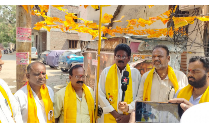
అధ్యక్షంలో ఘనంగా నిర్వహించడం జరిగింది . తెలుగుదేశం పార్టీ జెండా ఎగరవేయడం జరిగింది వారు మాట్లాడుతూ తెలుగుదేశం పార్టీ 1982 మార్చి 29న స్థాపించి కేవలం 9 నెలల లోనే అధికారంలోకి తీసుకువచ్చిన నాయకుడు అన్న ఎన్టీఆర్. సమాజమే దేవాలయం ప్రజలే దేవుళ్ళు అనే నినాదంతో తెలుగుదేశం పార్టీని స్థాపించి అధికారంలోకి వచ్చిన తర్వాత పటిల్ పట్వారీ వ్యవస్థను రద్దు పరచి ఆదేవిధంగా రెండు రూపాయల కిలో బియ్యం జనతా పత్రాలు రైతులకు విద్యుత్తు 50 రూపాయలకే

అందించిన ఘనత అన్న ఎన్టీఆర్ దక్కింది. ప్రతి పేదవానికి కూడా గూడు గుడ్డ అందినప్పుడే నిజమైన స్వాతంత్రం వచ్చినట్లు అని ఆరోజు ఎన్టీఆర్ చెప్పారు అదేవిధంగా తాలూకాలను రద్దుచేసి మాండలిక వ్యవస్థను ఏర్పాటు చేసి ప్రజల దగ్గరకు పాలను తీసుకువచ్చినారు తెలుగుదేశం పార్టీ మహిళలకు ఆస్తిలో సమాన హక్కు కల్పించిన మహాయుగ పురుషుడు అన్న ఎన్టీఆర్ తెలుగువారి ఆత్మగౌరవం కోసం పుట్టిన పార్టీ తెలుగుదేశం పార్టీ తెలుగువారి కీర్తి ప్రతిష్టలు యావత్ ప్రపంచానికి చాటి చెప్పిన మహోన్నత వ్యక్తి ఎన్టీఆర్ ఆయన చూపించిన మార్గంలో తెలుగుదేశం పార్టీ జాతీయ అధ్యక్షులు ఆంధ్రప్రదేశ్ ముఖ్యమంత్రి నారా చంద్రబాబు నాయుడు వాటిని ముందు తీసుకు వెళుతున్నారు అటువంటి పార్టీలు మేము ఉండడం మాకు ఎంతో గర్వకారణం అని కృష్ణయ్య తెలియజేశారు రాబోయే రోజుల్లో తెలుగుదేశం పార్టీ అధికారంలోకి వస్తుందని ఆశాభావం వ్యక్తం చేశారు.