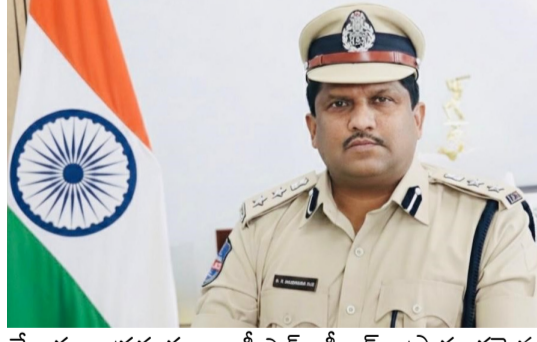
చేశారు. ప్రస్తుతం ఐపీఎల్ సీజన్ ప్రారంభమైన నేపథ్యంలో తల్లిదండ్రులు తమ పిల్లలపై ప్రత్యేక దృష్టి పెట్టాలని సూచించారు. ముఖ్యంగా వారు మొబైల్ ఫోన్ వినియోగం, ప్రవర్తనను గమనించాలని,