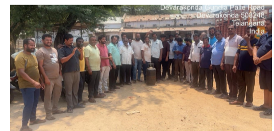
దోషబండ్ల ఫాస్ట్ ఫుడ్ భోజన హోటల్స్ రెస్టారెంట్లు వ్యాపారులు గండరగోళంలో అయోమయ పరిస్థితిలోకి వెళ్లారు.దేవరకొండ పట్టణంలోని తినుబండారాలు హోటల్ గప్పువ రెస్టారెంట్ లీ స్టాల్ లో ఫాస్ట్ ఫుడ్ మిర్చి బండి దోష బండి వ్యాపారం చేసే గత నెల

దేవరకొండ మార్చి 29 (మహాప్రభ ) రోడ్డుపై స్టాల్స్ మొదలుకొని రెస్టారెంట్ల వరకు ఏ చిన్న తిను పదార్థాల బండిపై గ్యాస్ తోనే వ్యాపారులు కొనసాగుతున్నారు. ప్రస్తుతం దేవరకొండ పట్టణంలో డెమోస్ట్రేట్ సివిల్ సప్లై కారణంగా గత్యంతరం లేక కమర్షియల్ సివిల్ సప్లై వాడడం అవి వెంటనే సివిల్ సప్లై ఎన్ఫోర్స్మెంట్ అధికారులు సివిల్ సప్లై సాఫ్ట్వేర్ చేస్తుండడంతో చేయడంతో దిక్కు తోచని స్థితిలో రోడ్డుపై తినుబండారాల కట్టలీన గప్పువ