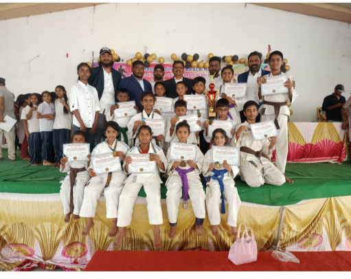
కరాటే పోటీలలో మెదక్ విద్యార్థుల ప్రతిభ.