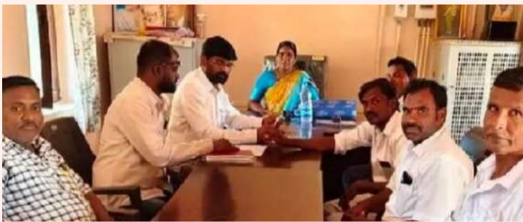
శివంపేట, ఏప్రిల్ 6(మహాప్రభ):

గ్రామాభివృద్ధిపై సమీక్ష గ్రంథాలయ ప్రాధాన్యతపై సూచనలు