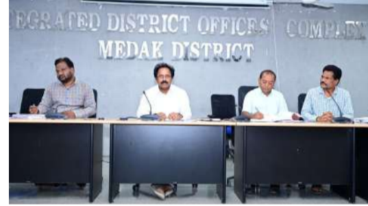
మెదక్ జిల్లా -06ఏప్రిల్ (మహాప్రభ )

-మొత్తం వరి ధాన్యం కొనుగోలు కేంద్రాలు 518 ఏర్పాటు -జిల్లా అదనపు కలెక్టర్.