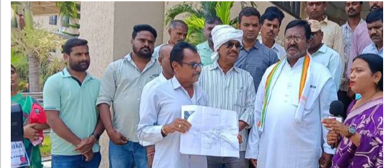
పాలకర్తి, 06 ఏప్రిల్ మహాప్రభ