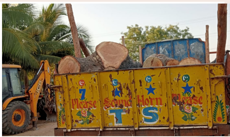
-నిలదీస్తే ఫారెస్ట్ అధికారులు పల్లెళ్లు ఇస్తున్నారని జవాబు. -పల్లెళ్లను లోని వృక్షాలకు పల్లెళ్లు ఇస్తున్నారా?

తూ.ప్రాన్, ఏప్రిల్ 7 (మహా ప్రభ) మెదక్ జిల్లా తూ.ప్రాన్ మరియు మనోహరాబాద్ మండలాలలో అక్రమ కలప వ్యాపారాలు జోరుగా కొనసాగు తున్నాయి. కలప వ్యాపారం నిర్వహించే నిర్వాహకులు పల్లెళ్లు లేకున్నా కలపను కొనుగోలు చేసి పాత వాటినే పల్లెళ్ల లుగా ఉన్నట్లు చూపిస్తున్నారు. కలపలో వేప, తుమ్మ, గానుగ, ఇలా ఏవివడితే వాటిని విక్రయదారుల నుండి కొనుగోలు చేసి అడ్డగోలుగా అమ్మకాలు జరుపుతున్నారు. గ్రామస్థులు కొందరు పల్లెట్ లేదా పల్లెళ్లు ఉన్నాయా అని అడిగితే ఫారెస్ట్ అధికారులు పల్లెళ్లు ఇస్తున్నారని ఎదురు బదిలిస్తున్నారు. ఒకవేళ ఫారెస్ట్