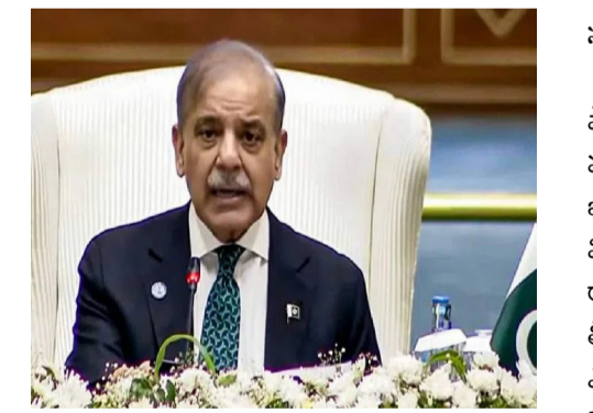
స్వాధీనీ, ఇరాన్ యుద్ధం ప్రభావం పాకిస్తాన్ పై గట్టిగా పడుతోంది. హార్టుజ్ జలసంధి మూసివేయడం, విదేశాల నుంచి చమురు రాకపోవడంతో పాకిస్తాన్ తీవ్ర సంక్షోభాన్ని ఎదుర్కుతోంది. చమురు కొరత ప్రభావంతో ఇప్పటికే

దేశంలో పలు ఆంక్షలు విధించిన పాక్ ప్రభుత్వం తాజాగా మరో కీలక నిర్ణయం తీసుకుంది. దేశంలో 'స్టార్ట్ లాక్ డౌన్' విధిస్తూ పాక్ ప్రధాని షేబాజీ షరీఫ్ ఆదేశాలు జారీ చేశారు. చమురు కొరతపై రాష్ట్రాల సీఎంలతో సమావేశం అనంతరం ఈ నిర్ణయం తీసుకున్నారు. చమురు వినియోగాన్ని తగ్గించేందుకు, ఉన్న నిల్వల్ని కాపాడుకునేందుకు ఈ నిర్ణయం తీసుకున్నట్లు పాక్ ప్రధాని చెప్పాడు. 'స్టార్ట్ లాక్ డౌన్' పై స్థానిక రేడియో వెల్లడించిన వివరాల ప్రకారం.. పాక్ లోని పంజాబ్, ఖైబర్ పక్తుంఖ్వా, బలూచిస్తాన్, ఇస్లామాబాద్, గిల్గిట్ బల్తిస్తాన్, పాక్ ఆక్రమిత కాశ్మీర్ వంటి ప్రాంతాల్లో పలు ఆంక్షలు విధించారు. మార్కెట్లు, షాపులు, ఇతర కమర్షియల్ స్పేస్ అన్నీ రాత్రి ఎనిమిది గంటలకు మూసేయాలి. కొన్ని ప్రాంతాల్లో మాత్రమే మినహాయింపులు ఇచ్చారు. అక్కడ రాత్రి 9 గంటల వరకు అనుమతి ఉంటుంది. జనరల్ స్టోర్స్, డిపార్ట్ మెంట్ స్టోర్స్ వంటివి ఎనిమిది గంటలకే మూసేయాలి. అలాగే, బేకరీలు, రెస్టారెంట్లు, ఇతర ఫుడ్ ఔట్ లెట్లు మాత్రం రాత్రి 10 గంటల వరకు తెరిచి ఉంచొచ్చు. అలాగే, పెళ్లి వేడుకలపై కూడా ఆంక్షలు విధించారు. రాత్రి 10 గంటల తర్వాత ఇళ్లలో మాత్రమే పెళ్లి వేడుకలు తక్కువ మందితో నిర్వహించుకోవాలి. మెడికల్ స్టోర్స్, ఫార్మసీలు మాత్రం ఎల్లప్పుడూ తెరిచి ఉంటాయి. ఈ ఆంక్షల్ని మంగళవారం నుంచే అమలు చేయబోతున్నట్లు ప్రభుత్వం తెలిపింది. కొన్ని చోట్ల ప్రైవేటు వాహనాలపై నిషేధం విధించారు. అలాగే, ప్రభుత్వ రవాణా ఉచితంగా అందిస్తున్నారు. నెల రోజులపాటు గిల్గిట్, ముజఫ్ ఫరాబాద్ వంటి చోట్ల ఉచిత ప్రయాణం చేయవచ్చు. హార్టుజ్ జలసంధి తెరిచి, చమురు అందుబాటులోకి వచ్చే వరకు ఈ పరిస్థితి ఉంటుందని పాక్ అధికార వర్గాలు తెలిపాయి.