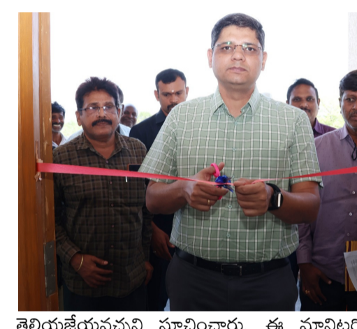
తెలియజేయవచ్చని నూచించారు. ఈ మానిటరింగ్