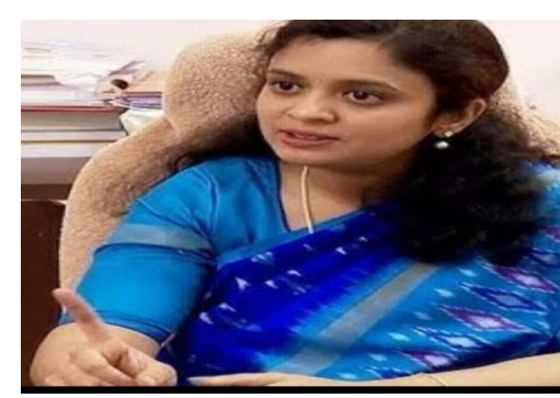
దరఖాస్తులను ఈనెల 10వ తేదీన జరిగే రాష్ట్రస్థాయి అక్రిడేషన్ కమిటీ సమావేశంలో స్క్రూట్ ని చేసి అర్జులైన జర్నలిస్టులకు కొత్త అక్రిడేషన్ కార్డులను

-నిరంతరం అక్రిడేషన్ దరఖాస్తుల ప్రక్రియ -సమాచార పౌర సంబంధాల శాఖ స్పెషల్ కమిషనర్ సిహెచ్.ప్రియాంక దుబ్బాక - ఏప్రిల్ 07 (మహాప్రభ) అక్రిడేషన్ దరఖాస్తుల ప్రక్రియ నిరంతరం కొనసాగుతుందని సమాచార పౌర సంబంధాల శాఖ స్పెషల్ కమిషనర్ సిహెచ్.ప్రియాంక వారు ఒక ప్రకటనలో తెలిపారు. దరఖాస్తుల ప్రక్రియ పై ఇటీవల మీడియాలో వస్తున్న వార్తలపై జర్నలిస్టులు ఎటువంటి ఆందోళన చెందవద్దని కమిషనర్ ఆ ప్రకటనలో పేర్కొన్నారు. రాష్ట్రస్థాయిలో ఇప్పటివరకు వచ్చిన