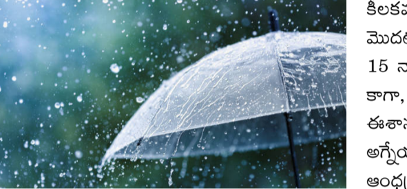
2026 వర్షాకాలం సీజన్లో నమోదయ్యే వర్షపాతం అంచనాలను భారత వాతావరణ శాఖ వచ్చే వారంలో విడుదల చేయనుంది. భారత్ లో ఏడాదిలో నమోదయ్యే వర్షపాతంలో దాదాపు 70 శాతం వరకూ నైరుతి రుతుపవనాల వల్లే సాధ్యమవుతుంటుంది. నైరుతి రుతుపవనాలు జూన్ నుంచి సెప్టెంబర్ వరకూ వరి, పత్తి, చెరుకు సహా ఖరీఫ్ పంటల సాగుకు

-సగటుకన్నా తక్కువ వర్షపాతం నమోదు -వాతావరణ సంస్థ సైమెట్ వెల్లడి