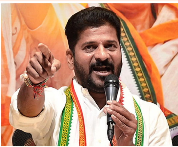
మరచిపోయి చాలా కాలం అయ్యింది. ఎన్డీవీ తరపున మోడీ మంచి మిత్రులని సీఎం రేవంత్ విమర్శలు విజయన్ కేరళంలో పని చేస్తున్నారు.

కేరళం యువత హార్ట్ వర్కింగ్ పీపుల్ అని సీఎం రేవంత్ రెడ్డి కొనియాడారు. తాజాగా కేరళం ఎన్నికల ప్రచారంలో పాల్గొన్న సీఎం రేవంత్ అక్కడి ప్రభుత్వంపై విమర్శలు గుప్పించారు. గల్ఫ్ దేశాల అభివృద్ధిలో కేరళం యువత పాత్ర కీలకమన్నారు. కేరళంలోనే విషాద స్థోరీలకు యునైటెడ్ డెమోక్రటిక్ ఫ్రంట్ ప్రభుత్వం చరమాంకం పలుకుందన్నారు. యూడిఎఫ్ గవర్నమెంట్ వస్తుందని ధీమా వ్యక్తం చేశారు. పినరయి విజయన్ అంటే తనకు గౌరవమని.. కానీ ఆయన ప్రభుత్వం అంటే తనకు నచ్చదన్నారు. ఊమెస్ చాండీ కరుణాకర్ ఆధ్వర్యంలో కేరళ అభివృద్ధి చెందిందన్నారు. కేరళకు పినరయి విజయన్, మోడీలు వద్దు. పినరయి విజయన్ జ్యోతి బను, సోమనాథ్ చట్టీలను