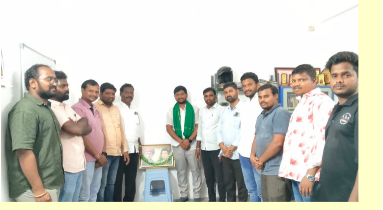
దేవరకొండ ఏప్రిల్ 11 (మహాప్రభ)