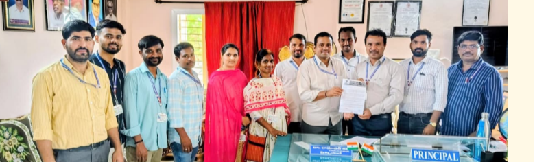
దేవరకొండ ఏప్రిల్ 11 (మహాప్రభ)