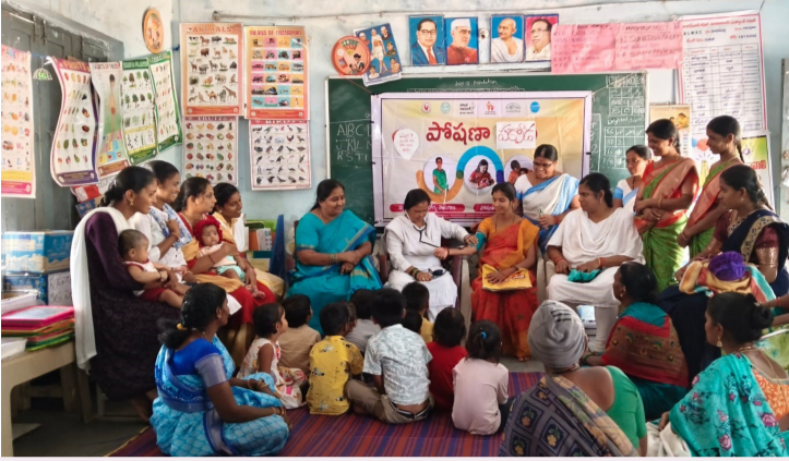
గాంధారి, ఏప్రిల్ 11 (మహాప్రభ)

-తల్లి బిడ్డకు మొదటి గురువు -సూపర్ వైజర్ భారతి