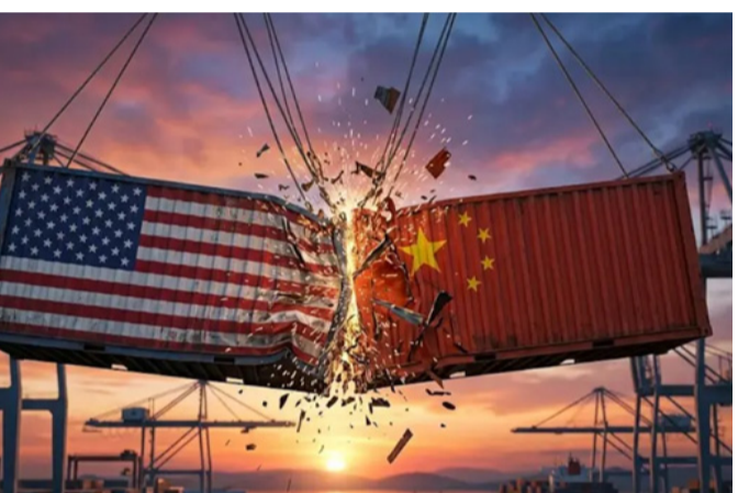
విధిస్తామని ట్రంప్ అన్నారు. ఇరాన్తో చైనా చమురు వాణిజ్యాన్ని నిలిపివేసి, దానికి బదులుగా వెనిజులా

వాషింగ్టన్ : అమెరికా అధ్యక్షుడు డోనాల్డ్ ట్రంప్ మరోసారి చైనాపై బెదిరింపులకు దిగారు. ఇరాన్ నుంచి చమురు కొనుగోలు కొనసాగిస్తే చైనాపై 50% వరకు అదనపు సుంకాలు విధిస్తామని ఆయన ప్రకటించారు. ఈ చర్య ద్వారా ఇరాన్ ఆర్థిక వనరులను అడ్డుకోవడం, చైనా వాణిజ్య ఆధిపత్యాన్ని నిరోధించడం అమెరికా లక్ష్యంగా పెట్టుకుంది. అంతర్జాతీయ ఆంక్షలు ఉన్నప్పటికీ చైనా ఇరాన్ నుంచి చమురును ప్రధానంగా కొనుగోలు చేస్తోంది. ఇది ఇరాన్ ఆర్థిక స్థిరత్వాన్ని కాపాడటానికి సహాయపడుతున్నందున ఈ హెచ్చరిక జారీ చేయబడింది. చైనా నుంచి వచ్చే ఉత్పత్తులపై అదనపు పన్నులు విధిస్తామని ట్రంప్ గతంలోనే హెచ్చరించారు. ఇరాన్తో సంబంధాలు కొనసాగితే, ఈ చర్యలను మరింత కఠినతరం చేస్తామని, 50% పన్ను