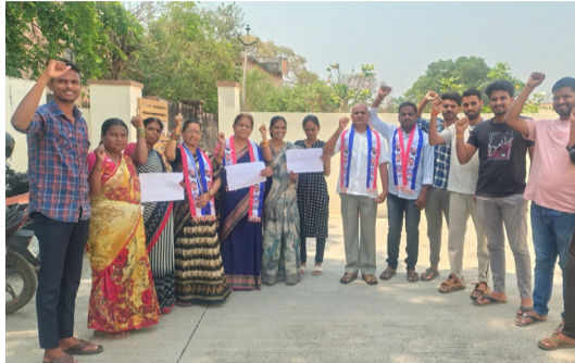
జరగలేదన్నారు... మహిళలు సామాజికంగా రాజకీయంగా ఆర్థికంగా ఎదగాలంటే మహిళలను చైతన్యం కావాలంటే మహిళలకు సమాజంలో గౌరవం