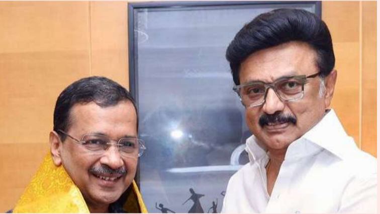
చెన్నై : ఏప్రిల్ 20 ( మహాప్రభ)

అమె ఆద్య్ పార్టీ జాతీయ కన్వీనర్ అరవింద్ కేజ్రీవాల్ సోమవారం తమిళనాడు ముఖ్యమంత్రి ఎం.కె స్టాలిన్ ను కలిశారు. ఈ సందర్భంగా స్టాలిన్ చేపట్టిన విద్య, ఆరోగ్యసంరక్షణ, మహిళల సాధికారతకు సంబంధించి కీలక రంగాల్లో ప్రభుత్వం చేస్తున్న కృషిని కేజ్రీవాల్ స్టాలిన్ ప్రశంసించారు. ఈ మేరకు ఆయన సామాజిక మాధ్యమం ఎక్స్ లో పోస్టు చేశారు. 'తమిళనాడు ముఖ్యమంత్రి తిరు ఎం.కె స్టాలిన్ ను కలవడం గౌరవంగా ఉంది. విద్య, ఆరోగ్య సంరక్షణ, మహిళా సాధికారత విషయాలలో మా ఇద్దరికీ ఒకే విధమైన దృక్పథం ఉంది. మేము ఎల్లప్పుడూ ఒకరి నుండి ఒకరు నేర్చుకుంటూనే ఉన్నాము. తమిళనాడు ప్రజల జీవితాలను మార్చడంలో ఆయన అంకితభావంతో చేస్తున్న పాలనను నేను ఎంతగానో అభినందిస్తున్నాను- అని కేజ్రీవాల్ పోస్టు లో పేర్కొన్నారు.