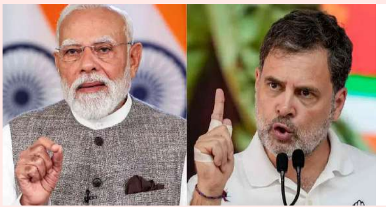
తూతుకుడి, ఏప్రిల్ 20 ( మహాప్రభ)

అమెరికా అధ్యక్షుడు డోనాల్డ్ ట్రంప్ చెప్పినట్లే ప్రధాని మోదీ ప్రవర్తిస్తున్నారని కాంగ్రెస్ నేత రాహుల్ గాంధీ ఆరోపించారు. తమిళనాడులోని తూతుకుడిలో జరిగిన ఎన్నికల సభలో ఆయన మాట్లాడుతూ.. ట్రంప్ ఆదేశాల ప్రకారమే మోదీ ఇజ్రాయెల్ పర్యటనకు వెళ్లినట్లు తెలిపారు. ఫిబ్రవరి 28వ తేదీన అమెరికా-ఇజ్రాయెల్ దళాలు అకస్మాత్తుగా ఇరాన్ పై అటాక్ చేసిన విషయం తెలిసింది. అయితే ఆ ఘటనకు మూడు రోజుల ముందే ప్రధాని మోదీ ఇజ్రాయెల్ లో పర్యటించారు. ఆయన నెతన్యూహాతో భేటీ అయ్యారు. ఈ అంశాన్ని రాహుల్ గాంధీ తన ఎన్నికల ప్రచార ప్రసంగంలో ప్రస్తావించారు. ఒకవేళ ట్రంప్ దూకమంటే, మోదీ దూకేస్తారని అన్నారు. ఇరాన్ లో వార్ ప్రారంభంకావడానికి ముందు ట్రంప్ ఆదేశాల ప్రకారం మోదీ ఇజ్రాయెల్ వెళ్లి వచ్చారని, దానికి కారణం చాలా సింపుల్ అని, ఎవ్ స్టేట్స్ ఫైల్స్.. అదాని అని రాహుల్ ఆరోపించారు.