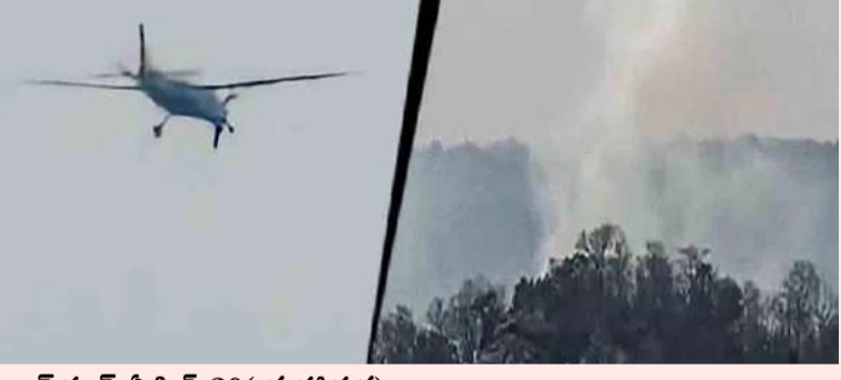
రామ్ పూర్ ఏప్రిల్ 20 ( మహాప్రభ)

ఒక ఫైవేట్ జెట్ విమానం చెట్టును ఢీకొట్టింది. అదుపుతప్పిన అది కొండపై కూలింది. సంఘటనా స్థలంలో మంటలు, పొగలు కనిపించాయి. పోలీసులు, అధికారులు సంఘటనా స్థలానికి చేరుకున్నారు ఛత్తీస్ గఢ్ లోని జమ్ పూర్ జిల్లాలో ఈ సంఘటన జరిగింది. సోమవారం జమ్ పూర్ -- నారాయణ్ పూర్ అటవీ ప్రాంతంపై తక్కువ ఎత్తులో ఎగురుతున్న ఫైవేట్ జెట్ విమానం ఒక చెట్టును ఢీకొట్టింది. అదుపుతప్పిన ఆ విమానం కొండ వాలుపై కూలిపోయింది. దీంతో మంటలు, పొగలు కనిపించాయి. కాగా, ఈ సమాచారం తెలుసుకున్న పోలీసులు, అధికారులు సంఘటనా స్థలానికి చేరుకున్నారు. కూలిన చార్జ్డ్ విమానంలోని ఫైలర్, కో ఫైలర్ మరణించినట్లు గుర్తించారు. ఈ విమానం కూలిన సంఘటనకు సంబంధించిన వీడియో క్లిప్స్ సోషల్ మీడియాలో వైరల్ అయ్యాయి.