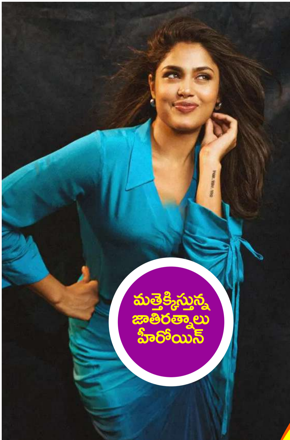
మత్తెక్కిస్తున్న జాతిరత్నాలు హీరోయిన్