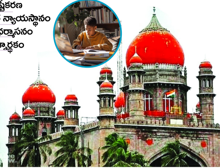
-మీనా 3 లో

హైదరాబాద్, ఏప్రిల్ 26 (మహాప్రభ): దూరవిద్యా విధానంలో డిగ్రీలు పూర్తి చేసి ప్రభుత్వ ఉద్యోగాల కోసం ఎదురుచూస్తున్న అభ్యర్థులకు తెలంగాణ హైకోర్టులో చుక్కెదురైంది. ఇతర రాష్ట్రాలకు చెందిన విశ్వవిద్యాలయాలు తమ రాష్ట్ర సరిహద్దులు దాటి నిర్వహిస్తున్న స్టడీ సెంటర్ల ద్వారా పొందే డిగ్రీలు ప్రభుత్వ ఉద్యోగాలకు పనికిరావని ఉన్నత న్యాయస్థానం స్పష్టంచేసింది.