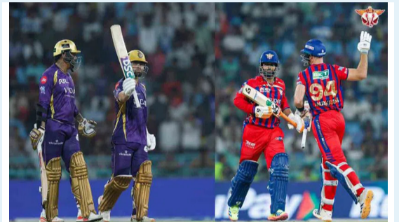
-మీనా 3 లో

న్యూఢిల్లీ, ఏప్రిల్ 26 (మహాప్రభ): ఐపీఎల్ 2026లో తొలి సూపర్ ఓవర్ నమోదైంది. లక్నో సూపర్ జయింట్స్ కోల్ కతా నైట్ రైడర్స్ మధ్య జరిగిన మ్యాచ్ సూపర్ ఓవర్ వరకు దారి తీసింది. ఉత్తంభ భారతంగా సాగిన మ్యాచ్ లో చివరకు కోల్ కతా నైట్ రైడర్స్.. సూపర్ ఓవర్ లో విజయం సాధించింది. ఈ ట్రోఫీలో రెండో విజయాన్ని నమోదు చేసింది. ఆరో ఓటమి చవిచూసిన లక్నో సూపర్ జయింట్స్.. పాయింట్స్ పట్టికలో