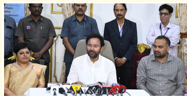
ప్రజలకు ఈ ప్రక్రియలో చురుకైన పాల్గొనాలని కోరిన కేంద్ర మంత్రి - సమగ్ర అభివృద్ధిలో జనాభా లెక్కలకు ఉన్న ప్రాముఖ్యతను వివరించిన శ్రీ జి. కిషన్ రెడ్డి - వికసన్ భారత్ సాధనలో జనాభా లెక్కల గణాంకాలు కీలక పాత్ర పోషిస్తాయన్న కేంద్ర మంత్రి