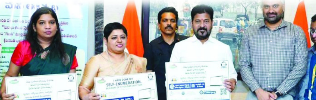
-మీనా 3 లో

హైదరాబాద్, ఏప్రిల్ 26 (మహాప్రభ): కాంగ్రెస్ ప్రజా ప్రభుత్వం ఏర్పడిన మరుసటి రోజు (08.12.2023) మహాత్మ జ్యోతిబాపూలే ప్రజాభవన్ లో ముఖ్యమంత్రి రేవంత్ రెడ్డి ప్రారంభించిన ప్రతి మంగళవారం 'సీఎం ప్రజావాణి' కార్యక్రమం ఆద్యుతంగా కొనసాగుతోందని సీఎం రేవంత్ రెడ్డి అభిప్రాయపడ్డారు. అన్ని విభాగాలకు చెందిన అధికారులు అక్కడికక్కడే ప్రజలు ఇచ్చే అభిప్రాయం, దరఖాస్తులను స్వీకరించి వేగవంతంగా వాటిని పరిష్కరించే చర్యలు చేపడుతున్నారని అన్నారు.