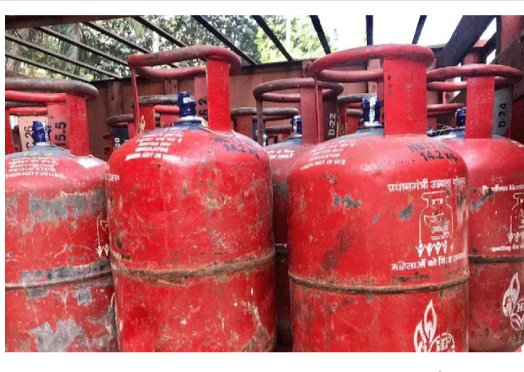
కనెక్షన్లు ఉన్న కుటుంబాలను గుర్తించే పనిలో పడింది. రెండు రకాల గ్యాస్ కనెక్షన్లు ఉన్నవారిని గుర్తించి వారికి ఎల్పీజీ గ్యాస్ కనెక్షన్లను కట్

హ్యూడ్స్ ఫీల్డ్ ఏప్రిల్ 30 (మహాప్రభ) ప్రైవేట్ గ్యాస్ కనెక్షన్ తీసుకున్న తర్వాత కూడా చాలా మంది లిక్విడ్ పెట్రోలియం గ్యాస్ ను వినియోగిస్తున్నారు. ఇలా రెండు గ్యాస్ కనెక్షన్లు కలిగి ఉండటంపై కేంద్ర ప్రభుత్వం గత నెలలో నిషేధం విధించింది. ఈ మేరకు మార్చి నెలలో ఉత్తర్వులు జారీచేసింది. ఆ ఉత్తర్వుల ప్రకారం పీఎన్జీ గ్యాస్ కనెక్షన్ తీసుకున్న వారు ఆ వెంటనే న్యూన్ గా ఎల్పీజీ గ్యాస్ కనెక్షన్లు వదులుకోవాలి. కానీ చాలా మంది అలా చేయడం లేదు. రెండు కనెక్షన్లను కొనసాగిస్తున్నారు. ఈ నేపథ్యంలో కేంద్ర సర్కారు దుర్వినియోగాన్ని అరికట్టడానికి, సబ్సిడీలను సమర్థంగా అందించడానికి రెండు రకాల గ్యాస్