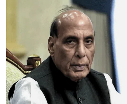
సమయంలోనే దాన్ని ముగించామని, అది స్వచ్ఛందంగా తీసుకున్న నిర్ణయమని అన్నారు. అవసరమైతే సుదీర్ఘ యుద్ధానికి పూర్తి సిద్ధంగా

హ్యూడ్స్ ఫీల్డ్ ఏప్రిల్ 30 (మహాప్రభ) పహ్లామ్ ఉగ్రదాడి కి ప్రతీకారంగా చేపట్టిన ఆపరేషన్ సింధూర్ ను భారత్ తన సొంత నిర్ణయం మేరకే నిలిపివేసింది కేంద్ర రక్షణశాఖ మంత్రి రాజ్ నాథ్ సింగ్ పేర్కొన్నారు. అవసరమైతే సుదీర్ఘ యుద్ధానికి సిద్ధంగా ఉన్నామని, ఏఎన్ఐ నిర్వహించిన నేషనల్ సెక్యూరిటీ సమ్మిట్ 2.02.0) లో మాట్లాడుతూ కేంద్ర మంత్రి ఈ వ్యాఖ్యలు చేశారు. సామర్థ్యం లేక ఆపరేషన్ సింధూర్ ను ఆపేయలేదని, అది ఒక వ్యూహాత్మకమైన నిర్ణయమని రాజ్ నాథ్ పేర్కొన్నారు. ఈ ఆపరేషన్ మన సాయుధ దళాల సమైక్యతకు కూడా ఒక ఉదాహరణ అని, ఇందులో మన త్రివిధ దళాలు సమన్వయంతో ముందుకు వెళ్లాయని రాజ్ నాథ్ సింగ్ చెప్పారు. సొంత నిబంధనల ప్రకారమే ఆపరేషన్ ప్రారంభించి సరైన