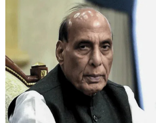
సమయంలోనే దాన్ని ముగించామని, అది స్వచ్ఛందంగా తీసుకున్న నిర్ణయమని అన్నారు. అవసరమైతే సుదీర్ఘ యుద్ధానికి పూర్తి సిద్ధంగా

న్యూఢిల్లీ ఏప్రిల్ 30 ( మహాప్రభ) పహ్లామ్ ఉగ్రదాడి కి ప్రతీకారంగా చేపట్టిన ఆపరేషన్ సింధూర్ ను భారత్ తన సొంత నిర్ణయం మేరకే నిలిపివేసిందిని కేంద్ర రక్షణశాఖ మంత్రి రాజ్ నాథ్ సింగ్ పేర్కొన్నారు. అవసరమైతే సుదీర్ఘ యుద్ధానికి సిద్ధంగా ఉన్నామని, ఏఎన్ఐ నిర్వహించిన నేషనల్ సెక్యూరిటీ సమ్మిట్ 2.02.0) లో మాట్లాడుతూ కేంద్ర మంత్రి ఈ వ్యాఖ్యలు చేశారు. సామర్థ్యం లేక ఆపరేషన్ సింధూర్ ను ఆపేయలేదని, అది ఒక వ్యూహాత్మకమైన నిర్ణయమని రాజ్ నాథ్ పేర్కొన్నారు. ఈ ఆపరేషన్ మన సాయుధ దళాల సమైక్యతకు కూడా ఒక ఉదాహరణ అని, ఇందులో మన త్రివిధ దళాలు సమన్వయంతో ముందుకు వెళ్లాయని రాజ్ నాథ్ సింగ్ చెప్పారు. సొంత నిబంధనల ప్రకారమే ఆపరేషన్ ప్రారంభించి సరైన