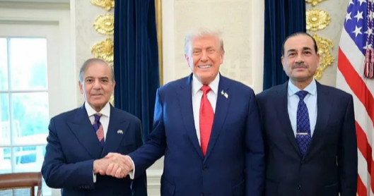
అడ్డుకుని, ఆర్థికంగా దెబ్బతీయాలనేది అమెరికా షాన్. ఇలా చేస్తే, ఇరాన్ దిగ్బంధన తమతో అణు ఒప్పందం చేసుకుంటుందని అమెరికా అధ్యక్షుడు డొనాల్డ్ ట్రంప్ భావిస్తున్నారు. ఈ నేపథ్యంలో ఇరాన్ నుంచి ఇతర దేశాలకు వాణిజ్యం చాలా వరకు ఆగిపోయింది. కానీ, ఈ విషయంలో ఇరాన్ కు పాకిస్తాన్ సాయం చేస్తోంది. ఇరాన్ వాణిజ్యం చేసుకునేలా తమ దేశం నుంచి ఆరు ప్రత్యేక భూ మార్గాల్ని పాకిస్తాన్ ప్రతిపాదించింది. హార్మూజ్ జలసంధిలో సంబంధం లేకుండా, అమెరికా దళాలకు దొరక్కూడా ఈ రూట్లలో ఇరాన్ వాణిజ్యం చేయొచ్చు. ఈ మార్గాల ద్వారా రష్యా, చైనా సహా

న్యూఢిల్లీ ఏప్రిల్ 30 ( మహాప్రభ) అమెరికా--ఇరాన్ మధ్య చర్చలకు మధ్యవర్తిత్వం వహిస్తున్న పాకిస్తాన్.. అమెరికాకు వెన్నుపోటు పొడుస్తుందా..? తాజా పరిణామాలు చూస్తుంటే జెనీవ్ అనిపిస్తోందని అమెరికా నిపుణులు అంటున్నారు. ఇరాన్ రవాణాకు అనుకూలంగా ఆరు మార్గాల్ని పాక్ ప్రతిపాదించినట్లు సమాచారం. ఒకవక్క హార్మూజ్ జలసంధిని దిగ్బంధించడం ద్వారా ఇరాన్ పై ఒత్తిడి తేవాలని అమెరికా భావిస్తుంటే.. పాకిస్తాన్ మాత్రం ఇరాన్ కు సాయం అందిస్తోందని అమెరికాకు చెందిన రక్షణ శాఖ నిపుణుడు డెరెక్ జె గ్రాస్ మన్ తెలిపారు. ఈ మేరకు సోషల్ మీడియా వేదికగా సంచలన విషయాలు వెల్లడించారు. డెరెక్ తెలిపిన వివరాల ప్రకారం.. హార్మూజ్ జలసంధిని అమెరికా దిగ్బంధించిన సంగతి తెలిసిందే. ఇప్పుడు ఇరాన్ పోర్టుల్ని కూడా అమెరికా దిగ్బంధంలోకి తీసుకుంటోంది. దీని ద్వారా ఇరాన్ వాణిజ్యన్ని