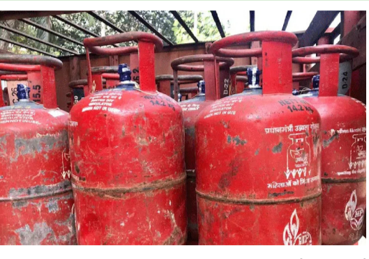
కనెక్షన్లు ఉన్న కుటుంబాలను గుర్తించే పనిలో పడింది. రెండు రకాల గ్యాస్ కనెక్షన్లు ఉన్నవారిని గుర్తించి వారికి ఎల్పీజీ గ్యాస్ కనెక్షన్లను కట్

న్యూఢిల్లీ ఏప్రిల్ 30 ( మహాప్రభ) ప్రైవేట్ గ్యాస్ కనెక్షన్ తీసుకున్న తర్వాత కూడా చాలా మంది లిక్విడ్ పెట్రోలియం గ్యాస్ ను వినియోగిస్తున్నారు. ఇలా రెండు గ్యాస్ కనెక్షన్లు కలిగి ఉండటంపై కేంద్ర ప్రభుత్వం గత నెలలో నిషేధం విధించింది. ఈ మేరకు మార్చి నెలలో ఉత్తర్వులు జారీచేసింది. ఆ ఉత్తర్వుల ప్రకారం పీఎన్జీ గ్యాస్ కనెక్షన్ తీసుకున్న వారు ఆ వెంటనే న్యూన్ గా ఎల్పీజీ గ్యాస్ కనెక్షన్లు వదులుకోవాలి. కానీ చాలా మంది అలా చేయడం లేదు. రెండు కనెక్షన్లను కొనసాగిస్తున్నారు. ఈ నేపథ్యంలో కేంద్ర సర్కారు దుర్వినియోగాన్ని అరికట్టడానికి, సబ్సిడీలను సమర్థంగా అందించడానికి రెండు రకాల గ్యాస్