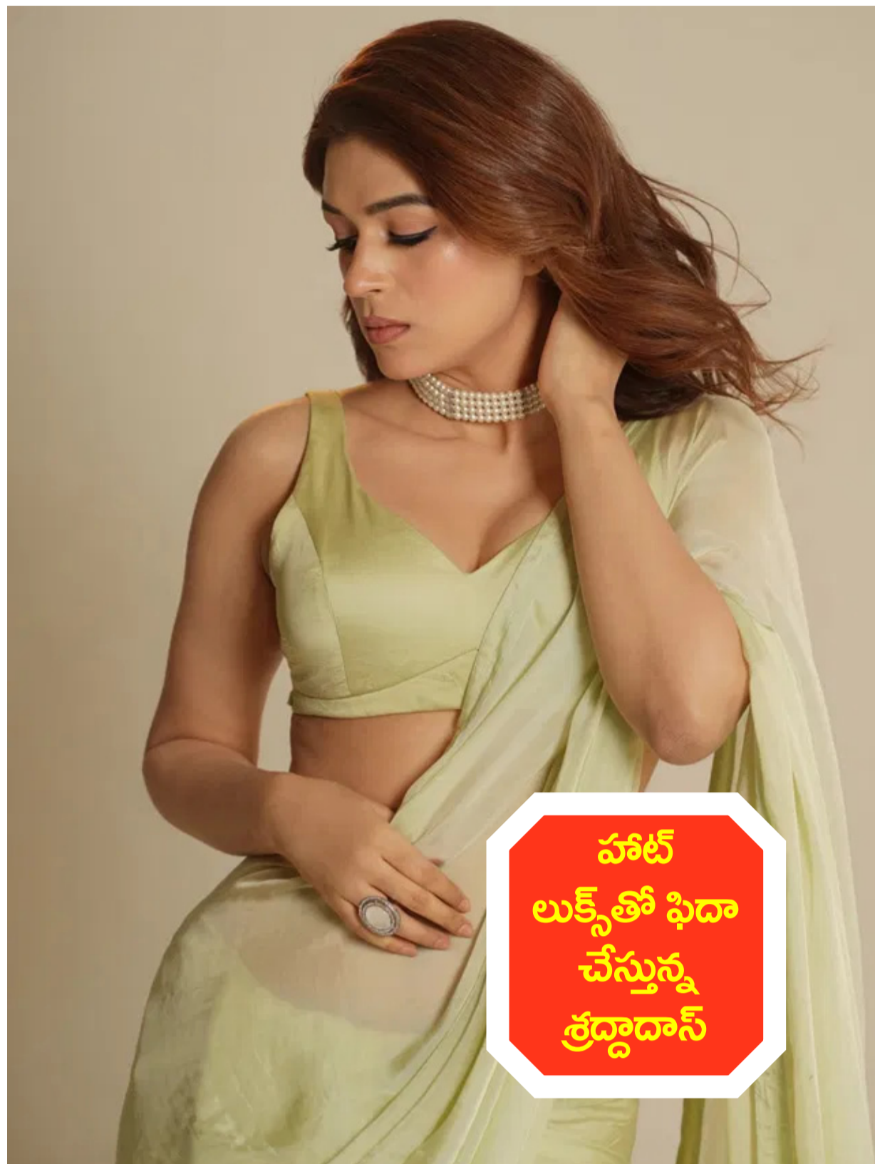
హాట్ లుక్స్ తో ఫిదా చేస్తున్న శ్రద్ధాదాస్