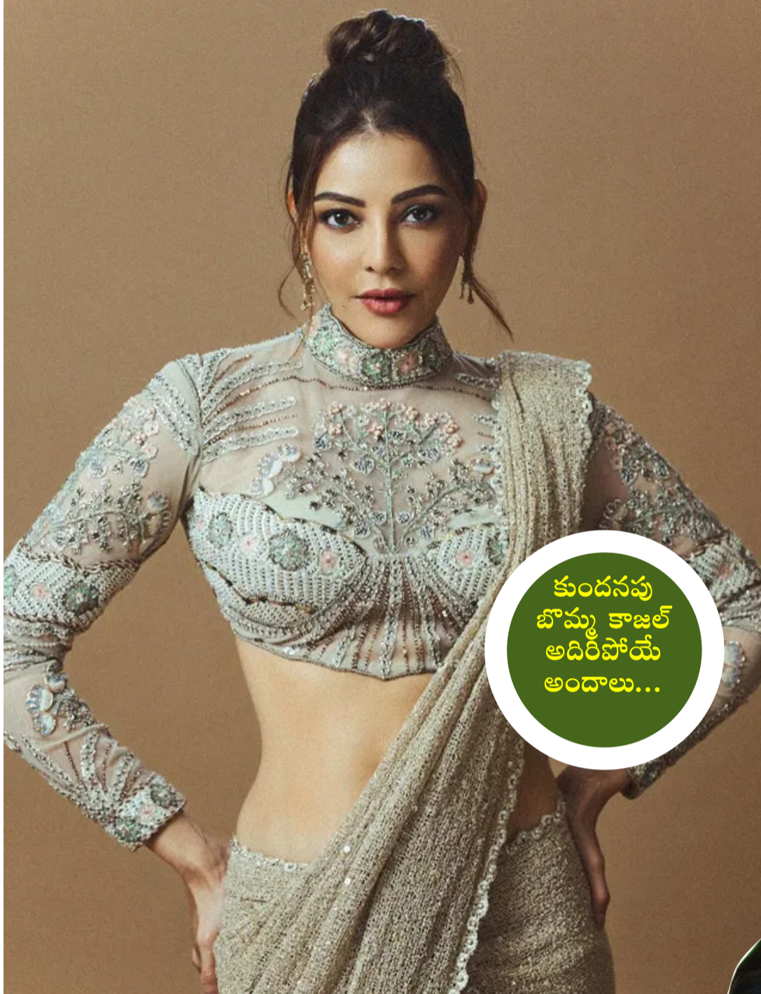
కుందనపు బొమ్మ కాజల్ అదిరిపోయే అందాలు...