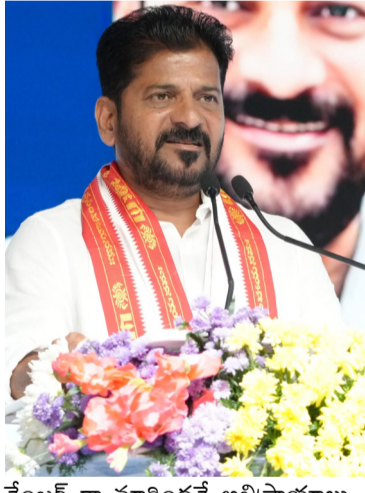
ఫ్రంజర్ గా మారిన రేవంత్ రెడ్డి ప్రాయాలు వ్యక్తం అవుతున్నాయి. ముఖ్యంగా పీసీసీ అధ్యక్షుడిగా -మిగతా 3 లో

హైదరాబాద్ 4 మే ( మహాప్రభ) దేశరాజకీయాల్లో తెలంగాణ ముఖ్యమంత్రి రేవంత్ రెడ్డి పేరు మరోసారి చర్చనీయాంశంగా మారింది. కేరళలో కాంగ్రెస్ నేతృత్వంలోని యునైటెడ్ డెమోక్రటిక్ ఫ్రంట్ (యూడిఎఫ్) విజయం వెనుక రేవంత్ రెడ్డి అనుసరించిన వ్యూహాలు హస్తం పార్టీలో ఆసక్తిని రేపుతున్నాయి. ఈ దెబ్బతో రేవంత్ రెడ్డి ఇమేజ్ మరోసారి కాంగ్రెస్ అభిషేకం వద్ద మరింత పెరిగినట్లు రాజకీయ విశ్లేషకులు అంచనా వేస్తున్నారు. తనకు ఇచ్చిన అవకాశాన్ని వాడుకుని ఎల్డీఎఫ్ ప్రభుత్వాన్ని గడ్డె దించడంలో రేవంత్ రెడ్డి పోషించిన పాత్ర గేమ్