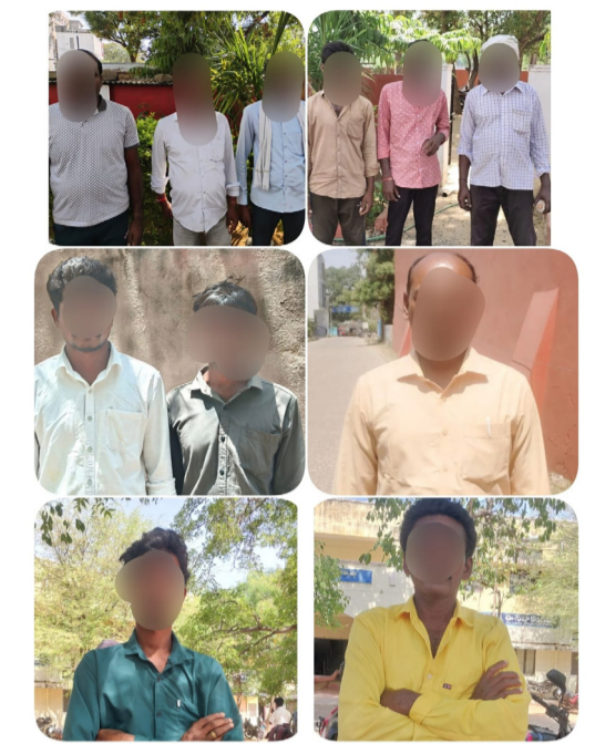
విధించగా, అందులో 7 మందికి ఒక రోజు, 2 మందికి రెండు రోజుల పాటు, మరో 2 మందికి

కామారెడ్డి మే 4 (మహాప్రభ) జిల్లాలో రోడ్డు ప్రమాదాలను తగ్గించడం మరియు ప్రజల ప్రాణాలను రక్షించడం లక్ష్యంగా కామారెడ్డి జిల్లా పోలీసులు డ్రంక్ అండ్ డ్రైవ్పై నిరంతరం తనిఖీలు నిర్వహిస్తున్నారు. మద్యం సేవించి వాహనాలు నడపడం వల్ల అమాంతుల ప్రాణాలు ప్రమాదంలో పడుతున్నాయని, ఇలాంటి నిర్లక్ష్యాన్ని ఎట్టి పరిస్థితుల్లోనూ సహించలేమని పోలీసులు హెచ్చరిస్తున్నారు. సోమవారం రోజున జిల్లా వ్యాప్తంగా నిర్వహించిన డ్రంక్ అండ్ డ్రైవ్ తనిఖీలలో మొత్తం 91 కేసులు నమోదు కాగా, మొత్తం 1,13,600/- జరిమానా విధించబడింది. అదనంగా 11 మందికి జైలు శిక్షలు