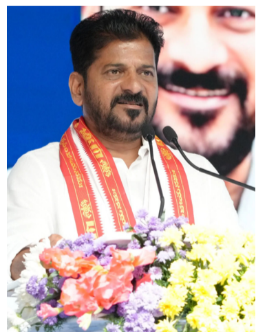
ఫ్రంజర్ గా మారిన అభిప్రాయాలు వ్యక్తం అవుతున్నాయి. ముఖ్యంగా పీసీసీ అధ్యక్షుడిగా -మిగతా 3 లో

హైదరాబాద్ 4 మే ( మహాప్రభ) దేశరాజకీయాల్లో తెలంగాణ ముఖ్యమంత్రి రేవంత్ రెడ్డి పేరు మరోసారి చర్చనీయాంశంగా మారింది. కేరళలో కాంగ్రెస్ నేతృత్వంలోని యునైటెడ్ డెమోక్రటిక్ ఫ్రంట్ (యూడీఎఫ్) విజయం వెనుక రేవంత్ రెడ్డి అనుసరించిన వ్యూహాలు హస్తం పార్టీలో ఆసక్తిని రేపతున్నాయి. ఈ దెబ్బతో రేవంత్ రెడ్డి ఇమేజ్ మరోసారి కాంగ్రెస్ అభిషేకం వద్ద మరింత పెరిగినట్లు రాజకీయ విశ్లేషకులు అంచనా వేస్తున్నారు. తనకు ఇచ్చిన అవకాశాన్ని వాడుకుని ఎన్ డిఎఫ్ ప్రభుత్వాన్ని గద్దె దించడంలో రేవంత్ రెడ్డి పోషించిన పాత్ర గేమ్