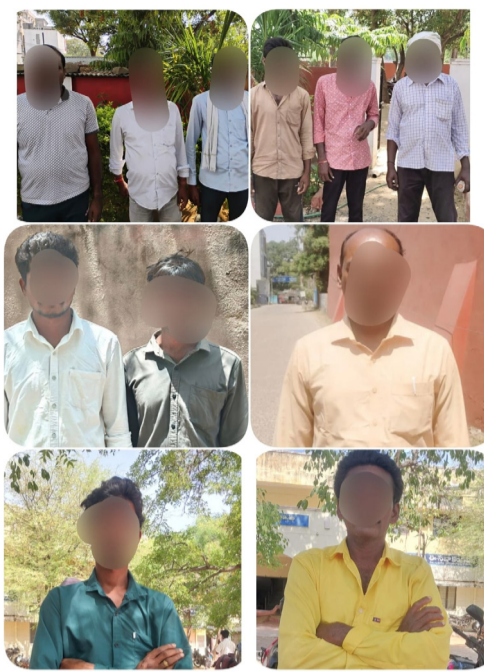
విధించగా, అందులో 7 మందికి ఒక రోజు, 2 మందికి రెండు రోజుల పాటు, మరో 2 మందికి

జిల్లాలో రోడ్డు ప్రమాదాలను తగ్గించడం మరియు ప్రజల ప్రాణాలను రక్షించడం లక్ష్యంగా కామారెడ్డి జిల్లా పోలీసులు డ్రంక్ అండ్ డ్రైవ్పై నిరంతరం తనిఖీలు నిర్వహిస్తున్నారు. మద్యం సేవించి వాహనాలు నడపడం వల్ల అమాంతుల ప్రాణాలు ప్రమాదంలో పడుతున్నాయని, ఇలాంటి నిర్లక్ష్యాన్ని ఎట్టి పరిస్థితుల్లోనూ సహించలేమని పోలీసులు హెచ్చరిస్తున్నారు. సోమవారం రోజున జిల్లా వ్యాప్తంగా నిర్వహించిన డ్రంక్ అండ్ డ్రైవ్ తనిఖీలలో మొత్తం 91 కేసులు నమోదు కాగా, మొత్తం 1,13,600/- జరిమానా విధించబడింది. అదనంగా 11 మందికి జైలు శిక్షలు