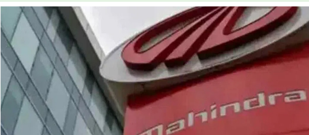
ఆర్జించింది. కంపెనీ బోర్డు సమావేశమై రూ.5 ముఖ డివిడెండ్ను ప్రకటించింది. విలువ కలిగిన ప్రతిషేరుకూ రూ.33 తుది

హ్యూడ్లీ, మే 5 : దేశీయ ఆటోమొబైల్ దిగ్గజాల్లో ఒకటైన మహింద్రా అండ్ మహింద్రా ప్రోత్సాహకర ఆర్థిక ఫలితాలను ప్రకటించింది. మార్చిలో ముగిసిన మూడు నెలల కాలానికి సంస్థ రూ.5,259.91 కోట్ల కన్సాలిడేటెడ్ నికర లాభాన్ని ఆర్జించింది. అంతర్జాతీయ ఏడాది ఇదే త్రైమాసికంలో నమోదైన రూ.3,541.85 కోట్ల లాభంతో పోలిస్తే 48.5 శాతం వృద్ధిని కనబరిచింది. సమీక్షకాలంలో కంపెనీ ఆదాయం రూ.42,585.67 కోట్ల నుంచి రూ.54,891.55 కోట్లకు ఎగబాకినట్లు బీఎన్ఈకి సమాచారం అందించింది. మరోవైపు, 2025-26 ఆర్థిక సంవత్సరానికిగాను రూ.1,97,792.78 కోట్ల ఆదాయంపై రూ.18,621.71 కోట్ల నికర లాభాన్ని