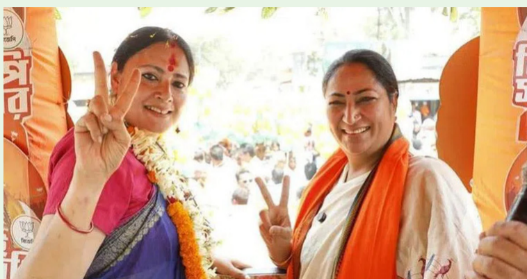
కోల్కతా మే 06( మహా ప్రభ)

చివ్విమ బెంగాల్ అసెంబ్లీ ఎన్నికల్లో బీజేపీ విజయం సాధించిన విషయం తెలిసిందే. ఆ రాష్ట్ర సీఎం రేసులో సువేందు అధికారితో పాటు దిలీప్ జోషి ఉన్నారు. అయితే మహిళలకు పెద్దపీట వేయాలనుకుంటున్న బీజేపీ.. బెంగాల్ లో సీఎం పోస్టును మహిళకు కేటాయించాలని భావిస్తున్నట్లు తెలుస్తోంది. ఒకవేళ చివర నిమిషంలో మహిళను సీఎంగా ప్రకటించాలని ప్రయత్నిస్తే, ఆ పోస్టు రేసులో అగ్నిమిత్ర పాల్ ముందు వరుసలో ఉన్నట్లు ఊహగానాలు వినిపిస్తున్నాయి. మే 9వ తేదీన కొత్త సీఎం ప్రమాణ స్వీకారోత్సవం ఉంటుందని బెంగాల్ బీజేపీ ఇప్పటికే ప్రకటించింది. మరో వైపు సీఎం పదవికి రాజీనామా చేసే ప్రసక్తి లేదని మమతా బెన్ద్రీ భీష్మించుకున్నారు. ఈ నేపథ్యంలో మహిళా సీఎం రేసులో అగ్నిమిత్ర పాల్ ఉన్నట్లు తెలుస్తోంది. తాజా ఎన్నికల్లో అసెంబ్లీలో దక్షిణ సీటు నుంచి పోటీ చేసి ఆమె 40 వేల మెజారిటీతో గెలిచారు. మమతా బెన్ద్రీకి కౌంటర్ ఇవ్వాలని బీజేపీ భావిస్తే, అగ్నిమిత్ర పాల్ ఆ రోల్ ప్లే చేసే అవకాశాలు ఉన్నాయి. అగ్నిమిత్ర ఓ ఫ్యాషన్ డిజైనర్. 2019 నుంచి 2024 వరకు ఎంపీగా చేశారామె. ఎన్నికల అఫిడవిట్ లో ఆమెపై పెండింగ్ కేసులు ఉన్నాయి. ఇక ఆ రాష్ట్ర పార్టీ అధ్యక్షుడు సామిక్ భట్టాచార్య కూడా సీఎం రేసులో ఉన్నారు.