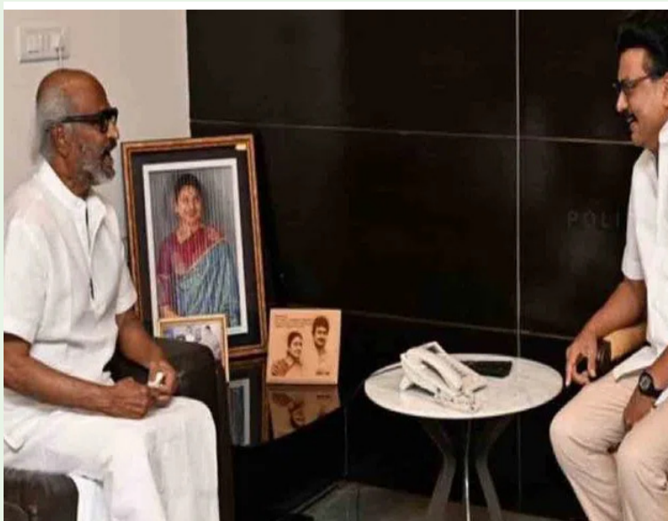
న్యూఢిల్లీ మే 06( మహా ప్రభ)

తమిళనాడు రాజకీయాల్లో వేగంగా మారుతున్న పరిణామాల మధ్య నేడు సూపర్ స్టార్ రజనీకాంత్ మాజీ ముఖ్యమంత్రి ఎం.కె. స్టాలిన్ తో భేటీ అయినట్లు తెలుస్తుంది. ఈ క్లిష్ట పరిస్థితుల్లో తాను స్టాలిన్ వెంటే ఉంటానని, ఆయనకు పూర్తి స్థాయిలో అండగా నిలుస్తానని రజనీకాంత్ హామీ ఇచ్చినట్లు తెలుస్తుంది. కేవలం వ్యక్తిగత పలకరింపు కాకుండా, ప్రస్తుత రాజకీయ పరిణామాల నేపథ్యంలో స్టాలిన్ కు ధైర్యం చెప్పడమే లక్ష్యంగా ఈ భేటీ జరిగినట్లు సమాచారం. మరోవైపు కాంగ్రెస్, ఇతర లెఫ్ట్ పార్టీలతో కలిసి డీఎంకే అధినేత విజయ్ ప్రభుత్వాన్ని ఏర్పాటు చేయబోతున్నట్లు తెలుస్తుంది. మే 07న విజయ్ ప్రమాణస్వీకారం ఉండబోతున్నట్లు సమాచారం