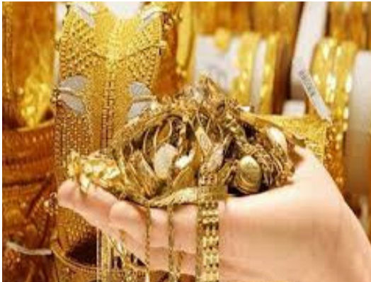
త్రోడవుతుంది. ఇక దేశ వ్యాప్తంగా ప్రధాన నగరల్లో బంగారం, వెండి ధరలు ఇలా ఉన్నాయి.

అంతర్జాతీయ ఉద్రిక్తతలు, రూపాయి విలువ మారకంతో బంగారం, వెండి ధరల్లో ఎప్పటికప్పుడూ మార్పులు వస్తుంటాయి. దానికితోడు తాజాగా హైదరాబాద్లోని పర్వేడ్ గ్రౌండ్లో జరిగిన బహిరంగ సభలో బంగారం కొనాద్యని ప్రధాని మోదీ చేసిన వ్యాఖ్యలు కూడా వాటి పేర్లపై భారీ ప్రభావం చూపాయి. మోదీ వ్యాఖ్యలు చేసిన మరుసటి రోజే మార్కెట్లో బంగారం షేర్లు భారీగా కుప్పకూలాయి. దీంతో బంగారం ధరల్లో కూడా మార్పులు రానున్నాయని నిపుణులు చెబుతున్నారు. అయితే గత నాగులు రోజులుగా బంగారం, వెండి ధరలు వరుసగా తగ్గుతూనే వస్తున్నాయి. కాబట్టి మంగళవారం తెలుగు రాష్ట్రాల సహా దేశ వ్యాప్తంగా ప్రధాన నగరాల్లో బంగారం వెండి ధరలు ఎలా ఉన్నాయో చూద్దాం. ప్రస్తుతం దేశీయ మార్కెట్లో 24 క్యారెట్ల 10 గ్రాముల బంగారం ధర రూ.1,52,120 గా ఉండగా నిన్న ఈ ధర 1,52,234గా ఉంది. ఇక 22 క్యారెట్ల 10 గ్రాముల బంగారం ధర చూసుకుంటే ప్రస్తుతం రూ.1,39,440 గా ఉండగా నిన్న ఈ ధర 1,39,640 గా ఉంది. ఇక ప్రస్తుతం దేశీయ మార్కెట్లో వెండి ధర చూసుకుంటే కేజీ వెండి ధర రూ.2,74,800 వద్ద