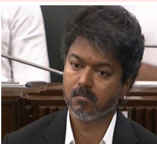
కామరాజు సైతం విజయ్కు మద్దతు ఇచ్చారు. ఒక్క ఎమ్మెల్యే ఉన్న డిఎంకే సైతం విజయ్కు మద్దతు తెలిపింది. డిఎంకే కాకట్ : డిఎంకేతో పాటు అన్నాడీఎంకే పశనిస్వామి వర్గం వ్యతిరేకించాయి. బలపరీక్షకు ముందుగానే విజయ్, తమిళనాడు ప్రజల విశ్వాసాన్ని కోల్పోయారని డిఎంకే

నేత ఉదయనిధి స్టాల్స్ ఆరోపించారు. 65 శాతం తమిళనాడు ఓటర్లు విజయ్కు వ్యతిరేకంగా ఓటు వేశారని పేర్కొన్నారు. తమ కూటమి పక్షాంతోనే ప్రభుత్వాన్ని ఏర్పాటు చేశారని ఎద్దేవా చేశారు. ఎన్నికల్లో ఇచ్చిన హామీలను ఎలా నెరవేరుస్తారని విజయ్ ప్రభుత్వాన్ని ప్రశ్నించారు. తమిళనాడులో రీల్ ప్రభుత్వం కాకుండా రియల్ ప్రభుత్వం ఉండాలని పేర్కొన్నారు. ఈ క్రమంలోనే ఓటింగ్కు దూరంగా ఉంటామని చెబుతూ 59 ఎమ్మెల్యేలు ఉన్న డిఎంకే కాకట్ చేసింది. తలసంగతి ఓజేపీ : అయితే బీజేపీ మాత్రం ఈ ఓటింగ్లో 'తలసంగతి' ఉండాలని నిర్ణయించింది. అన్నమఠి రామదాస్ నేతృత్వంలోని పీఎంకే ఓటింగ్కు దూరంగా ఉంటున్నట్లు వెల్లడించింది. మరోవైపు అన్నాడీఎంకే పశనిస్వామి వర్గం విజయ్కు ఓటు వ్యతిరేకంగా ఓటు వేస్తామని ముందే చెప్పింది. విజయ్ ప్రభుత్వం తమ పార్టీలోని కొందరు ఎమ్మెల్యేలకు డబ్బు ఆశ చూపి ఆకర్షించే ప్రయత్నం చేసిందని ఆరోపించారు. మరోవైపు అన్నాడీఎంకే పట్టుగం వర్గం పశనిస్వామి వ్యాఖ్యలను ఖండించింది. 25 మంది పట్టుగం వర్గం ఎమ్మెల్యేలు ప్రభుత్వానికి మద్దతుగా నిలిచారు.