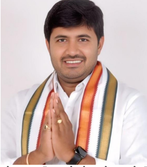
ధర్మేంద్ర ప్రధాన్ వెంటనే జోక్యం చేసుకుని పేపర్ లీకేజీలపై కఠిన చర్యలు తీసుకోవాలని ఆయన డిమాండ్ చేశారు. ప్రభుత్వ ఉద్యోగాల కోసం నిరుద్యోగులు తీవ్రంగా శ్రమిస్తున్న నేపథ్యంలో

కూకట్లూరి: దేశవ్యాప్తంగా నిర్వహిస్తున్న నీట్ సహజాతీయ స్థాయి పోటీ పరీక్షల్లో పరుసగా వెలుగులోకి వస్తున్న పేపర్ లీకేజీలపై కాంగ్రెస్ పార్టీ యువనేత గాదే శివ తీవ్ర ఆందోళన వ్యక్తం చేశారు. విద్యార్థులు, నిరుద్యోగుల భవిష్యత్తుతో ఎవరూ ఆటలాడవద్దని కేంద్ర ప్రభుత్వాన్ని ఆయన హెచ్చరించారు. పోటీ పరీక్షలకు విద్యార్థులు ఎన్నో కష్టాలు పడి సిద్ధమవుతున్న సమయంలో పేపర్ లీకేజీలు చోటుచేసుకోవడం అత్యంత దురదృష్టకరమని గాదే శివ పేర్కొన్నారు. ముఖ్యంగా నీట్ వంటి కీలక జాతీయ పరీక్షల సమయంలో హాస్టల్లో ప్రశ్నాపత్రాలు అమ్ముతున్నారనే ఆరోపణలు రావడం ఆందోళనకరమని అన్నారు. పరీక్షల నిర్వహణలో భద్రతా లోపాలు స్పష్టంగా కనిపిస్తున్నప్పటికీ సంబంధిత అధికారులు తగిన చర్యలు తీసుకోవడం లేదని విమర్శించారు. ప్రధాన మంత్రి నరేంద్ర మోదీ, కేంద్ర విద్యాశాఖ మంత్రి