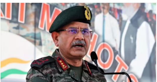
ఎదుర్కోవడంలో భారత సైనిక సన్నద్ధత ఈ ఆపరేషన్ ద్వారా స్పష్టమైందని తెలిపారు. ఆపరేషన్ సింధూర్ ను చాలా కచ్చితత్వంతో అమలు చేశామని చెప్పారు. 88 గంటల పాటు సాగిన ఆ ఆపరేషన్ లో భారత త్రివిధ దళాలు అత్యంత సమర్థవంతంగా పనిచేశాయని గుర్తు చేసుకున్నారు.

పొరుగు దేశం పాకిస్తాన్ కు భారత ఆర్మీ చీఫ్ జనరల్ ఉపేంద్ర ద్వివేది స్ట్రాంగ్ వార్నింగ్ ఇచ్చారు. పాకిస్తాన్ ఉగ్రవాదులకు ఆశ్రయం కల్పిస్తూ, భారత్ కు వ్యతిరేకంగా కార్యకలాపాలు కొనసాగిస్తే పరిణామాలు తీవ్రంగా ఉంటాయని హెచ్చరించారు.