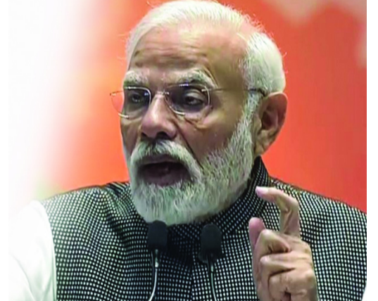
భారత్ అవకాశాల భూమిగా ఎదుగుతోందని ప్రధాని పేర్కొన్నారు. భారత్ ఒకేసారి టెక్నాలజీ ఆధారిత దేశంగా, మానవీయ విలువలను కాపాడే దేశంగా ముందుకు సాగుతోందన్నారు.

సేవలపై ప్రతి భారతీయుడు గర్వపడుతూ ఉన్నాడు. ది హెగ్ నగరం భారత్- నెదర్లాండ్స్ స్నేహానికి సజీవ చిహ్నంగా మారిందని ప్రధాని పేర్కొన్నారు.