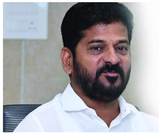
హామీ ఒడ్డి మాటగా మిగిలిందన్నారు. గత పదేళ్లుగా రూపాయి విలువ పతనమవుతూ వస్తోందని... ఇప్పుడు ఆ పతనం పరాకాష్టకు చేరిందని అన్నారు.

దేశవ్యాప్తంగా పెట్రోల్, డీజిల్ ధరల పెంపుపై ముఖ్యమంత్రి రేవంత్ రెడ్డి స్పందించారు. నరేంద్ర మోడీ సారథ్యంలోని కేంద్ర ప్రభుత్వం తాజాగా తీసుకున్న పెట్రోల్, డీజిల్ ధరల పెంపు నిర్ణయం ఏ మాత్రం సమర్థనీయం కాదని నోషల్ మీడియా ఎక్స్ ప్రెస్ చేసింది.