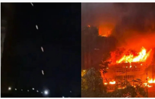
అత్యాధునిక హైపర్ సోనిక్ మిస్సైల్ ప్రయోగించినట్లు జెలెన్స్కీ ఆరోపించారు. ఇతర మిస్సైళ్లు, డ్రోన్లతోపాటు ఒరిజిన్ మిస్సైల్ ను కూడా ప్రయోగించినదని జెలెన్స్కీ ఆరోపించారు. వివిధ రకాల 90 మిస్సైల్స్ ప్రయోగించినదని, అందులో 36 బాలిస్టిక్ మిస్సైల్స్ కూడా ఉన్నాయని జెలెన్స్కీ అన్నారు. అలాగే, 600 డ్రోన్లు ప్రయోగించినదన్నారు. అయితే, వాటిలో చాలా

న్యూఢిల్లీ 24వే (మహాప్రభ): రష్యా--ఉక్రెయిన్ యుద్ధం మరోసారి తీవ్రరూపం దాల్చింది. ఉక్రెయిన్ పై రష్యా ఆదివారం భీకర దాడులకు దిగింది. ఈసారి అత్యంత ఆధునికమైన, శక్తివంతమైన హైపర్ సోనిక్ ఆయుధాన్ని ప్రయోగించినట్లు తెలుస్తోంది. ఉక్రెయిన్ రాజధాని కీవ్ నగరంపై రాత్రిపూట మిస్సైల్స్, డ్రోన్ల దాడితో రష్యా విరుచుకుపడింది. ఈ దాడుల్లో నగరంలో భారీ నష్టం జరుగగా, ఇద్దరు మరణించినట్లు మరొకొందరు గాయపడ్డారు. పట్టణంలోని స్కూళ్లు, నివాస బిల్డింగులు, మార్కెట్లు, ప్రభుత్వ కార్యాలయాలపై ఈ దాడి జరిగిందన్నారు. ఈ విషయాన్ని ఉక్రెయిన్ అధ్యక్షుడు జెలెన్స్కీ వెల్లడించారు. రష్యా తన వద్ద ఉన్న