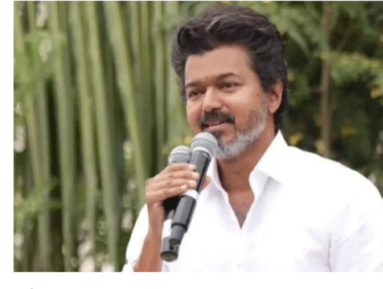
అంతేకాకుండా నటుడిగా విజయ్ కర్ణాటక వ్యాప్తంగా, ముఖ్యంగా బెంగళూరులో భారీ సంఖ్యలో అభిమాన సంఘాలు, బలమైన ఫాలోయింగ్ ఉంది. ఇటీవల తమిళనాడు ఎన్నికల్లో డీవీకే సాధించిన చారిత్రాత్మక విజయాన్ని బెంగళూరులోని విజయ్

న్యూఢిల్లీ 24వే (మహాప్రభ): తమిళనాడు అసెంబ్లీ ఎన్నికల్లో ప్రభంజనం సృష్టించి అధికార పక్షం చేపట్టిన ప్రముఖ నటుడు, తమిళనాడు ముఖ్యమంత్రి విజయ్ ఇప్పుడు పొరుగు రాష్ట్రాలపై దృష్టి సారించారా..? ముందుగా కర్ణాటక రాజకీయాల్లో ఎంట్రీ ఇవ్వబోతున్నారా..? తన పార్టీ డీవీకే విస్తరణలో భాగంగా ఆయన త్వరలో జరగబోయే బెంగళూరు మున్సిపల్ కార్పొరేషన్ (డీవీపీ) ఎన్నికల్లో పోటీ చేయాలని నిర్ణయించుకున్నారా..? ఈ ప్రశ్నలన్నింటికీ తమిళనాడులోని డీవీకే వర్గాలు అవుసరనే సమాధానం చెబుతున్నాయి. కర్ణాటకలో పార్టీ బెండా పాతాలని విజయ్ గట్టి సంకల్పంతో ఉన్నట్లు ఆయన పార్టీ వర్గాలు అంటున్నాయి. ఐటీ హాట్ అయిన బెంగళూరు నగరంలో స్థానిక కన్నడిగులతో పాటు లక్షలాది మంది తమిళ ప్రజలు దశాబ్దాలుగా నివసిస్తున్నారు.