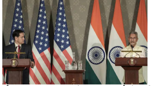
ఇటీవల అమెరికా టూరిస్ట్ వీసాలు, హెచ్1బీ వీసాల్లో ఇండియన్స్ ఇబ్బందులు ఎదుర్కొంటున్నట్లు రుబియో ప్రశ్నించారు. తాము ఇండియాను ప్రత్యేకంగా టార్గెట్ చేయలేదని, తమ నిబంధనలు అన్ని దేశాలకు వర్తిస్తాయన్నారు. ఇండియన్స్ పై అమెరికాలో జరుగుతున్న జాతి వివక్ష దాడులపై కూడా ఆయన మాట్లాడారు. ప్రతి దేశంలో కొందరు మూర్ఖులు

న్యూఢిల్లీ 24వే (మహాప్రభ): ఇటీవలి కాలంలో హెచ్1బీ వీసాలు సహా అనేక అంశాల్లో అమెరికా కొత్త నిబంధనలు రూపొందించిన సంగతి తెలిసిందే. అమెరికాలో ఉంటున్న చాలా మందికి గ్రీన్ కార్డులు రాక ఇబ్బందులు పడుతున్నాయి. దీనిపై అమెరికా విదేశాంగ మంత్రి మార్క్సి రుబియోతో భారత విదేశాంగ మంత్రి జైతంకర్ ప్రశ్నించారు. అయితే, తాము కొత్త నిబంధనల పేరుతో ఇండియాను టార్గెట్ చేయలేదని రుబియో అన్నారు. అమెరికా, ఇండియా విదేశీ మంత్రుల మధ్య న్యూఢిల్లీలో ఆదివారం చర్చలు జరిగాయి. ఈ సందర్భంగా అనేక అంశాలపై ఇరువురు నేతలు చర్చించుకున్నారు.