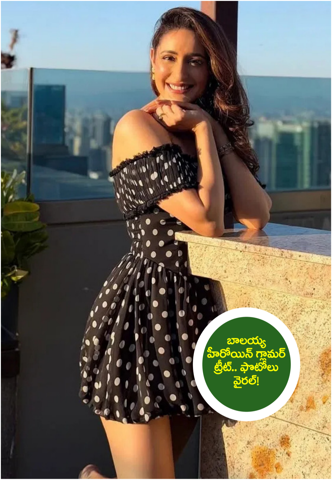
బాలయ్య హీరోయిన్ గామర్ ట్రీట్.. ఫాటోలు వైరల్!