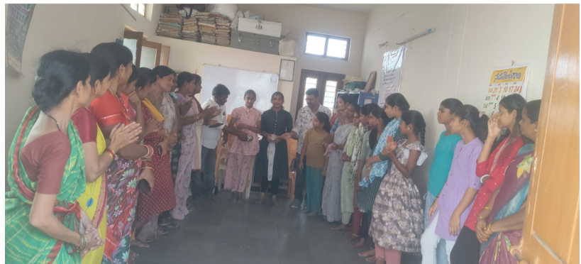
- కిషోర్ బాలికల నాయకత్వ లక్షణాలపై సమీక్ష సమావేశం

గాంధారి, మే 29 (మహా ప్రభ) గాంధారి మండలం కేంద్రంలో ఐకెపి అధ్యక్షులలో స్నేహ సంఘాల ఏర్పాటు ద్వారా కిషోర్ బాలికల్లో నాయకత్వ లక్షణాలు, ఆత్మవిశ్వాసం, సామాజిక అవగాహన గణనీయంగా పెరుగుతున్నాయి. గ్రామ స్థాయిలో ఏర్పడుతున్న ఈ సంఘాలు బాలికలకు తమ అభిప్రాయాలను వ్యక్తపరచడానికి, సమస్యలను గుర్తించి పరిష్కార మార్గాలు అన్వేషించడానికి మంచి వేదికగా నిలుస్తున్నాయి. సమీక్ష సమావేశంలో బాలికలలో కనిపించిన ముఖ్యమైన నాయకత్వ